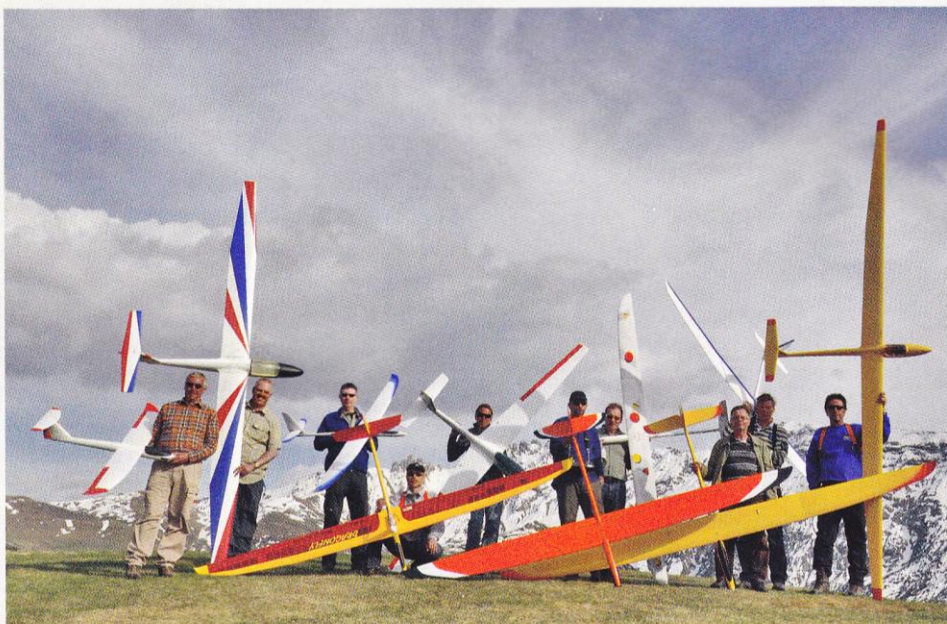
Fast alle Teilnehmer der Hangflugwoche auf einem Bild. Das war schwierig, denn meistens flogen die Jungs.