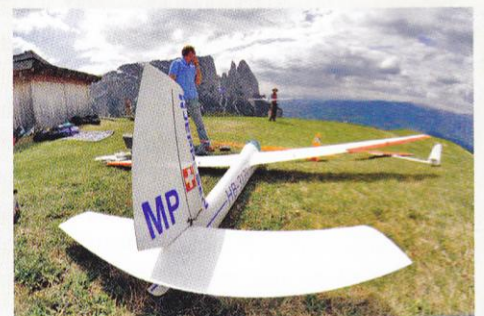
Ungewöhnliche Perspektive